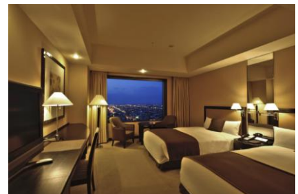
JR タワーホテル日航札幌客室

※当選者の発表：キャンペーン終了後速やかに厳正な抽選のうえ当選者を決定し、賞品の発送をもって発表に代えさせていただきます。なお、賞品の発送は3 月を予定しております。